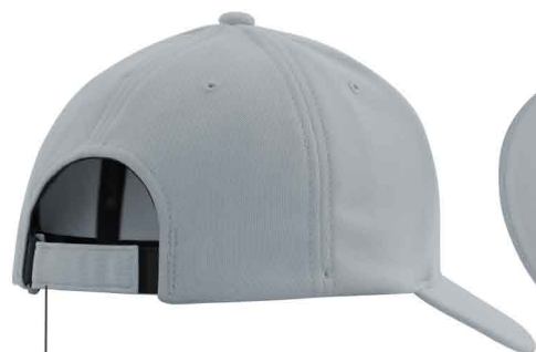
Fermeture auto-agrippante ajustable